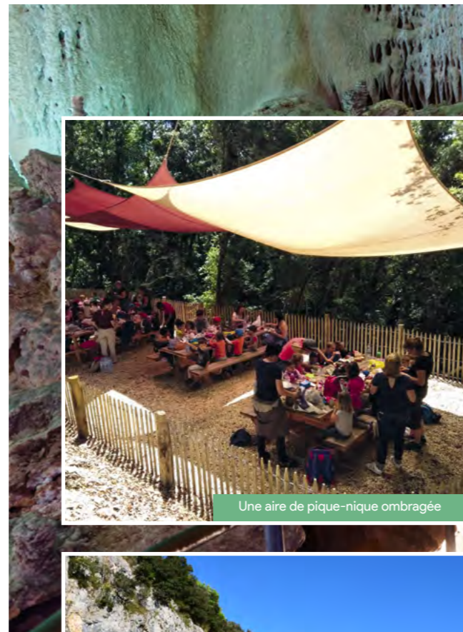
Une aire de pique-nique ombragée

En plus des visites guidées, l'équipe de la Salamandre a imaginé à proximité directe de la Grotte de nombreuses activités pour les enfants, comme un parcours aventure suspendu, des animations familiales ou une initiation à l'orpaillage en toute autonomie, sans oublier de très beaux espaces de détente, comme une aire de pique-nique ombragée ou une terrasse panoramique perchée au-dessus d'un ancien bras de rivière. Se baigner ou naviguer en canoë, parcourir à pied ou en courant les jolis sentiers au cœur de la forêt méditer-ranéenne, évoluer en spéléologie dans l'une des centaines de grottes des gorges de la Cèze, les environs de la Grotte de la Salamandre regorgent d'opportunités supplémentaires pour se relaxer, pratiquer des activités sportives en pleine nature ou des moments ludiques en famille. De quoi satisfaire les envies de tous, des plus petits aux plus grands !