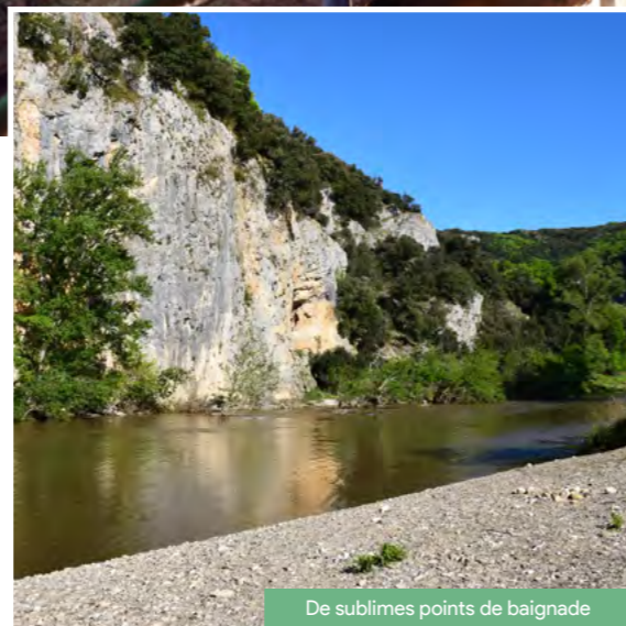
De sublimes points de baignade